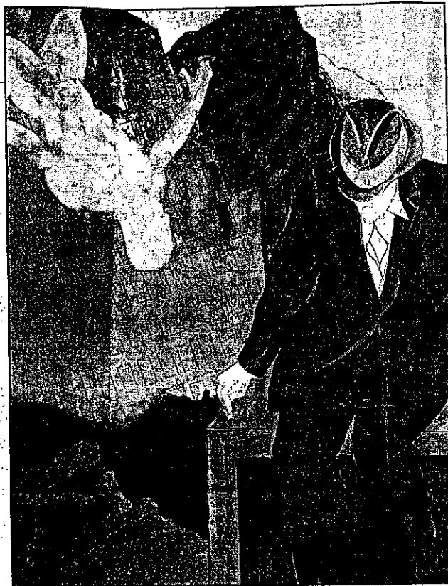
Από τη Ζωγραφική του σκηνογράφου Νίκου Γεωργιάδη

Εδώ, ο επισκέπτης έχει τη δυνατότητα να απομονώσει το χώρο από τη λήψη, κατανοώντας εν τέλει, όχι μόνο τη σκέψη του σκηνογράφου αλλά και το αίτημα του σκηνοθέτη για μια παράσταση άχρονη. Ουσιαστικά ο εκλεκτικισμός του Λεβίδη στην σκηνογραφική δουλειά, φέρνει το χρόνο, πίσω-μπρος, στο παρόν μέσω της πρώιμης αναγεννησιακής μνήμης, πιο πίσω στο χρόνο του λευκού της ληκύθου, στο χρώμα της εγκαυστικής του τάφου της Ευρυδίκης, πιο κοντά μας, στο γαυδες κόκκινο της Πομπήας κι ακόμη πιο κοντά, στη βυζαντινή τοιχοποιία ή στη διάταξη του λαϊκού ελληνικού σπιτιού που, βουτώντας στο χρόνο, πλησιάζει κάπου το Μυκηναϊκό Μέγαρο. Η ιστορία αφήνεται στο πέταγμα του λόγου και ο «τεχνίτης» αναπα-