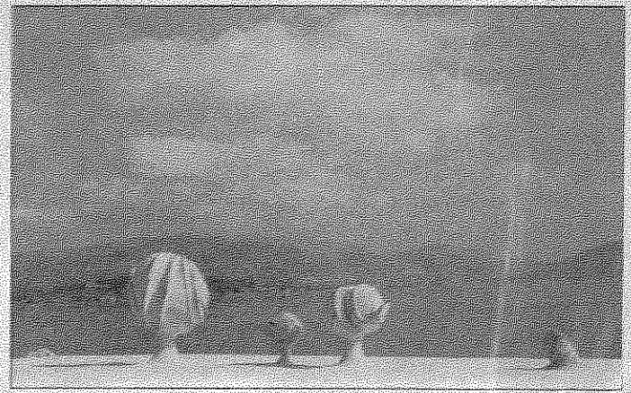
Φιλόλαος, Παράλας του Βόλου. Πρώτη αρχιτεκτονική.

όσο και μια ζωφόρος ή ένα σύμπλεγμα εθνών που μάχονται κενταύρους.